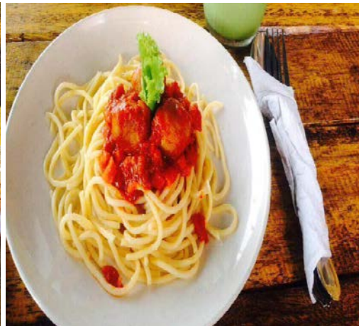
Caption : Antara produk yang dijual