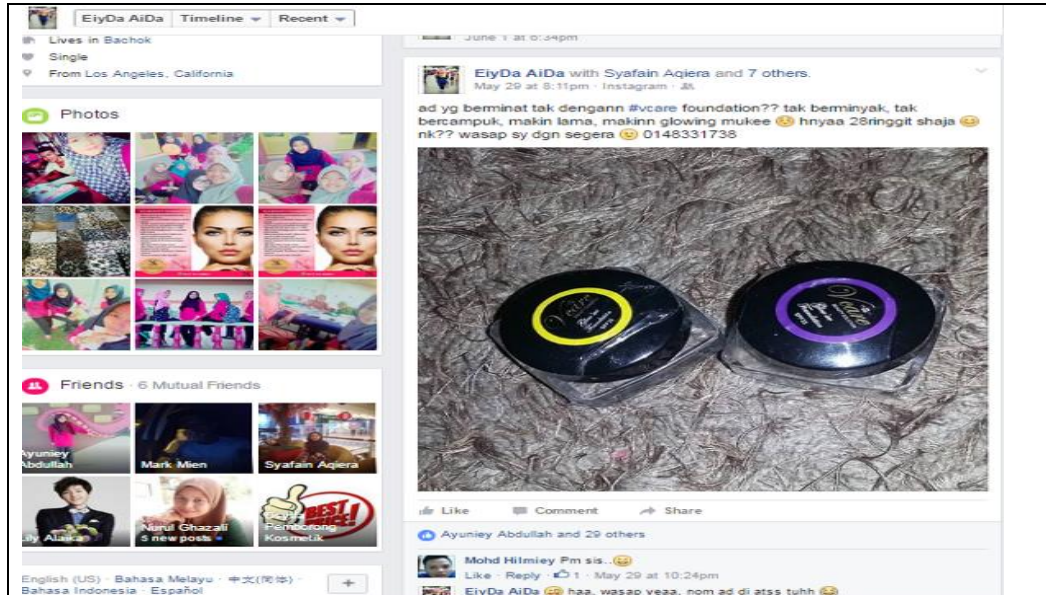
Caption : Dropship Produk Kecantikan VCare Foundation